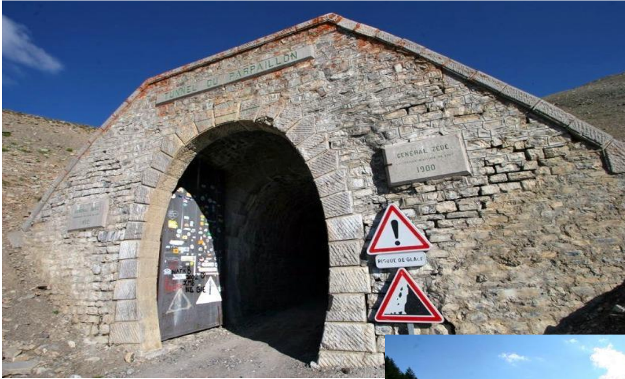
Nordwest Portal Tunnel du Parpaillon