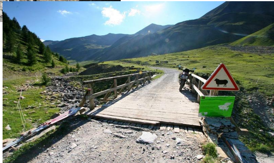
Holzbrücke Südost Rampe