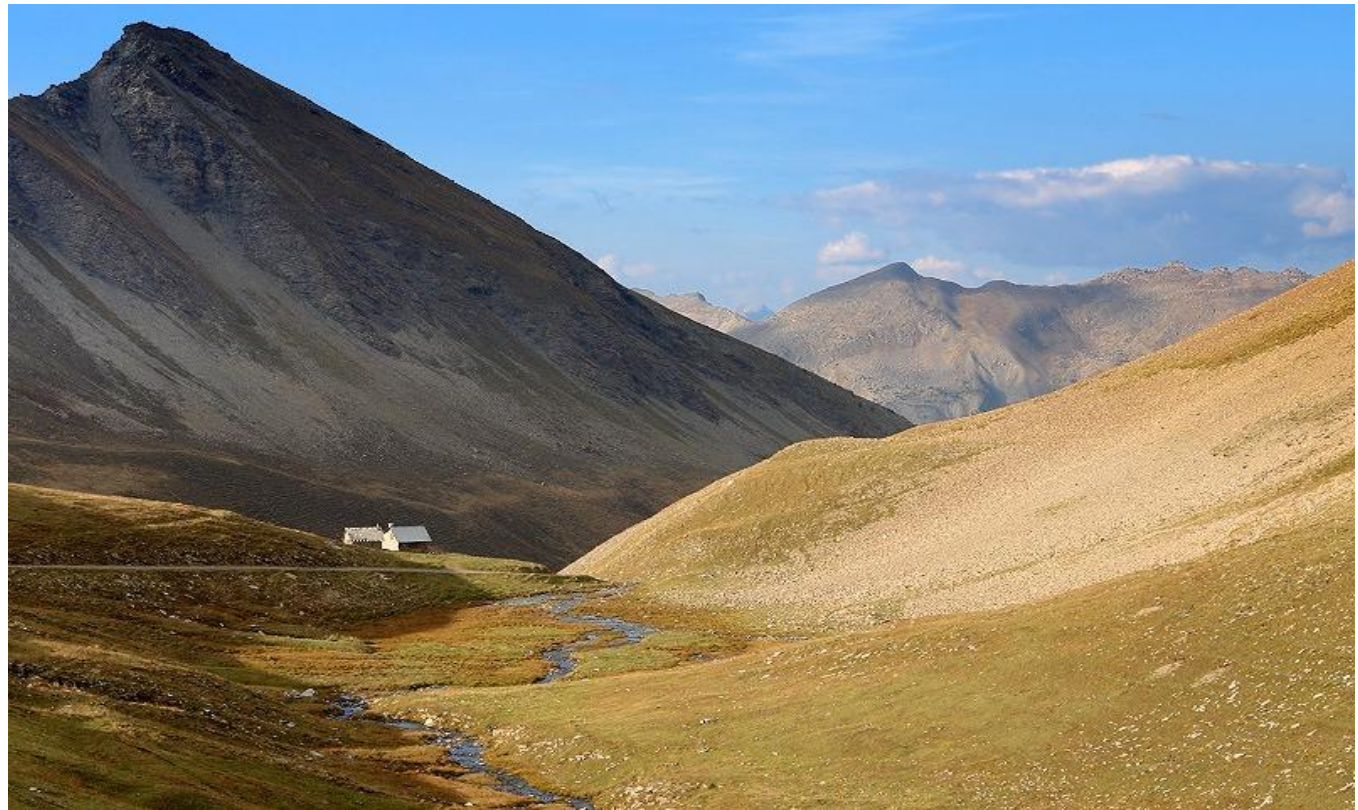
Landschaft Nordwest Rampe